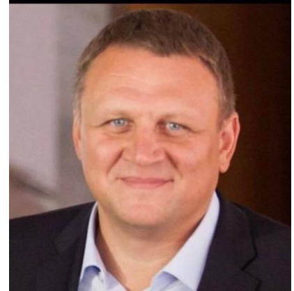
Posel Ukrainy Aleksander Szewczenko